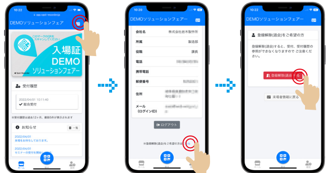
画面に沿って、登録を解除ください。 ※すでに受付済みの情報は削除されません