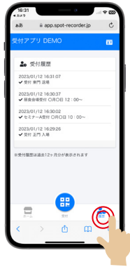
受付を行った履歴が全て確認 できます