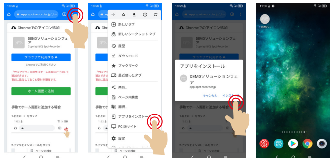
ホーム画面に戻るとアイコンが作成されています

インストールボタンをタップ 表示されていない場合は、右上の📄をタップし「アプリをインストール」