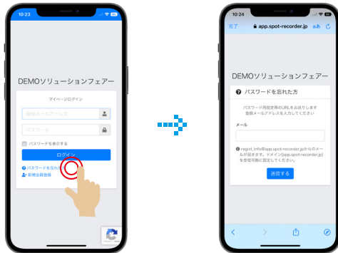
パスワードを忘れた方を タップ