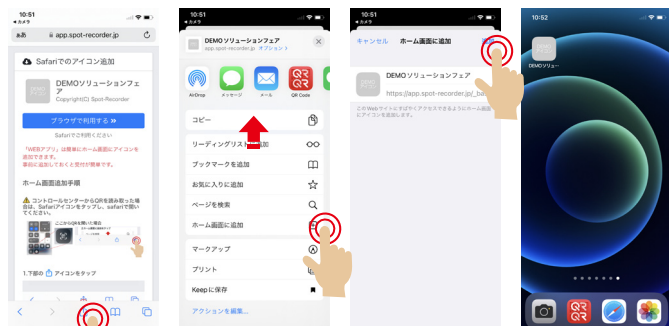
アイコンが作成されます