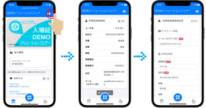
登録情報に変更があった場合は、右上のメンバーアイコンをタップし、 変更ボタンから修正ください